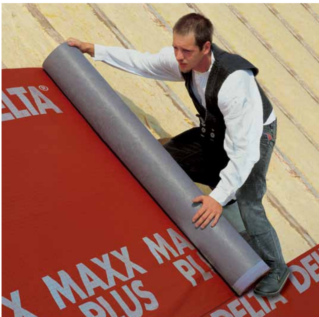
DELTA®-MAXX PLUS Membrana energooszczędna. Prosta i bezpieczna przy układaniu.