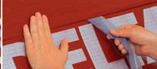
Taśmę ściągając. Brzeg dociskając. Gotowe!