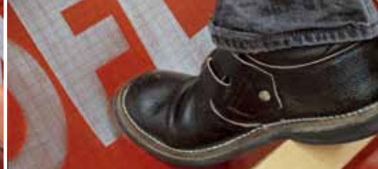
Odporna na obciążenia i bezpieczna przy chodzeniu.