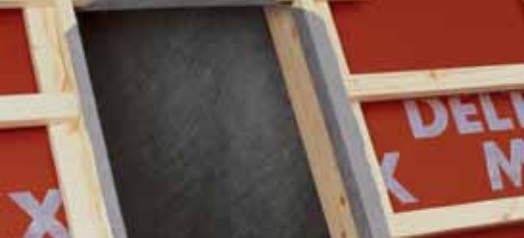
Detal przy montowaniu okna dachowego.